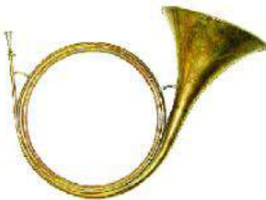
Cor de chasse