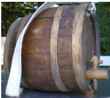
Le "barricot" de la cantinière